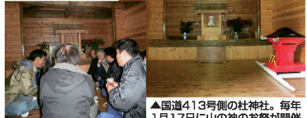
▲国道413号側の杜神社。毎年1月17日に山の神のお祭が開催。

道志村子ども農山漁村地域協議会 道志村観光協会 〒402-0211 山梨県南都留郡道志村6894-4 TEL 0554-52-1414 FAX 0554-52-1415 URL http://doshi-kanko.com