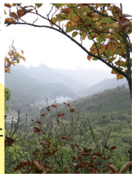
▲矢頭山頂上から遠く善之木集落の先に矢崎方面を望む